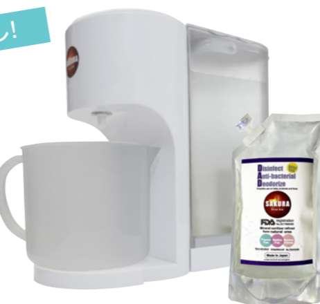
サクラ ウイルスカット ミネラルサーバーキット 400ml