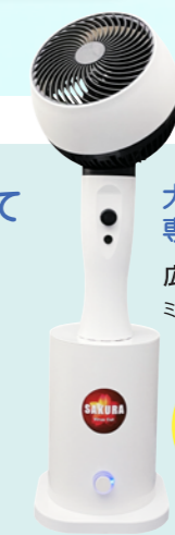
サクラ ウイルスカット ミストサーキュレーター