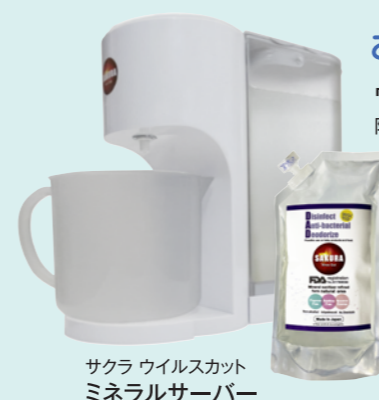
サクラ ウイルスカット ミネラルサーバー

お使いの加湿器に入れて ワンタッチでかんたん操作！ 除菌水が作れる濃縮液と専用サーバー