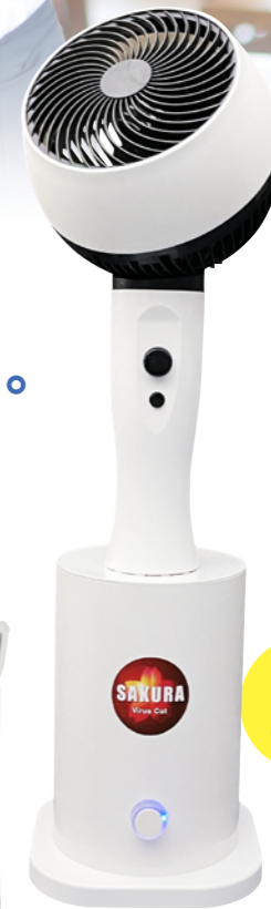
サクラ ウイルスカット ミストサーキュレーター